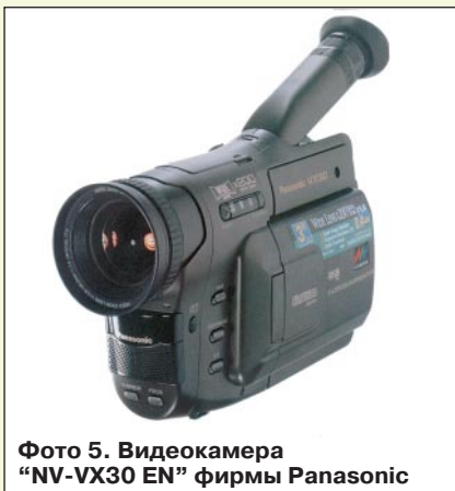
Фото 5. Видеокamera “NV-VX30 EN” фирмы Panasonic

В графе “Мощн. потр.” начальное значение интервала указывает потребление энергии при отключенном мониторе, конечное — при работе с монитором.