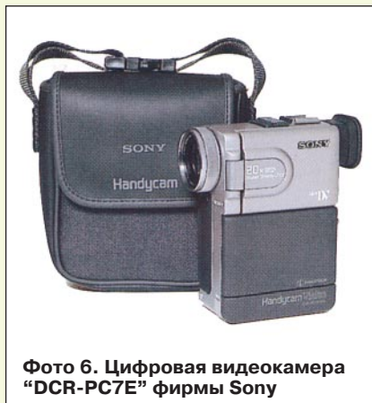
Фото 6. Цифровая видеокamera “DCR-PC7E” фирмы Sony