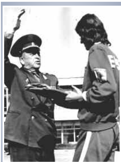
И. Т. Пересыпкин вручает приз победителю соревнований, 1974 г.

В 1960—1970 гг. И. Т. Пересыпкин возглавлял Федерацию радиоспорта СССР, Всесоюзную коллегию судей по радиоспорту, Историческую комиссию при Президиуме научно-технического общества радиотехники, электроники и связи имени А. С. Попова. На праздновании 100-летия г. Горловки городской Совет депутатов трудящихся в мае 1968 г. вручил маршалу войск связи И. Т. Пересыпкину ленту "Почётный гражданин Горловки". Одна из улиц города названа его именем. В 2023 г. в парке "Патриот" создан городок военных связистов, в котором 20 октября в 104-ю годовщину войск связи установлен памятник маршалу И. Т. Пересыпкину. Здесь силами Управления связи Министерства обороны России и при участии членов семьи был открыт мемориальный кабинет И. Т. Пересыпкина.