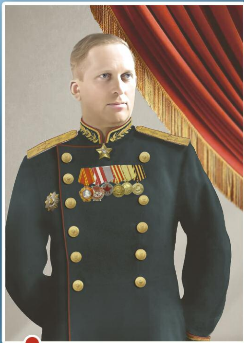
Маршал войск связи И. Т. Пересыпкин (1945 г.).

Навсегда останутся в моей памяти трудные годы Великой Отечественной войны. В августе и сентябре 1943 г. войска Юго-Западного и Южного фронтов под командованием прославленных советских полководцев Р. Я. Малиновского и Ф. И. Толбухина вели ожесточенные бои за освобождение Донбасса от гитлеровских захватчиков. В то время по долгу службы я попеременно находился в штабах этих фронтов.