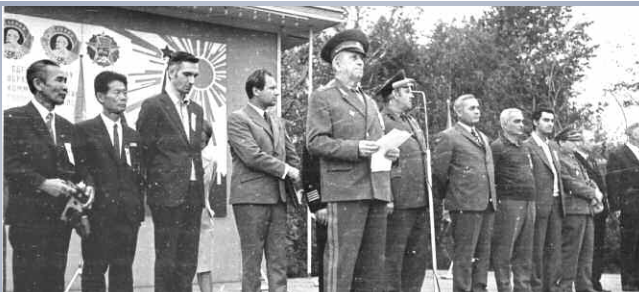
И. Т. Пересыпкин открывает соревнования по радиоспорту в Измайловском парке, 1974 г.

В послевоенные годы И. Т. Пересыпкин — начальник войск связи Сухопутных войск, а по 1957 г. — начальник войск связи Советской армии. В этот период он много труда вложил в совершенствование и развитие новых технических средств связи и методов управления, подготовку высококвалифицированных кадров военных связистов.