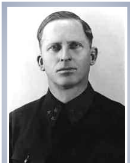
Народный комиссар связи, 1941 г.

Радиосвязь в далёкие годы государственного строительства СССР и в наши дни стала важнейшим средством управления страной, организации промышленности, предоставления широкого спектра услуг населению. Техника связи вокруг нас: на земле, под водой, в воздухе и далёком космосе. Выдающийся государственный деятель и военачальник Иван Терентьевич Пересыпкин посвятил свою жизнь развитию и совершенствованию связи в нашей стране.