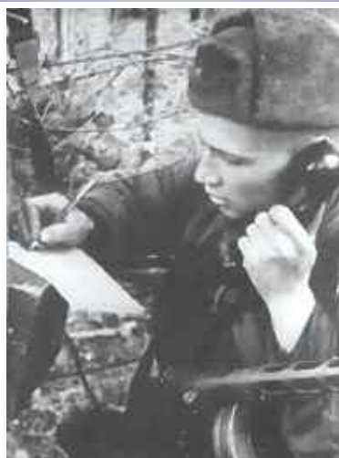
Солдат-связист принимает радиограмму.

градом связисты не делились на военных и гражданских, все они совместно работали, обеспечивая связь, ... самоотверженно выполняли свой долг перед Родиной". Вот что рассказывал об использовании радиосвязи маршал Советского Союза Андрей Иванович Ерёменко: "Во время Сталинградской битвы радио стало важнейшим нервом армейского организма, без которого он не мог нормально функционировать. Штабы всех степеней могли успешно осуществлять своё руководство лишь с помощью радиосвязи. Характерно, что именно те командиры, которые постоянно пользовались радиосвязью, обеспечивали непрерывное и надёжное управление войсками".