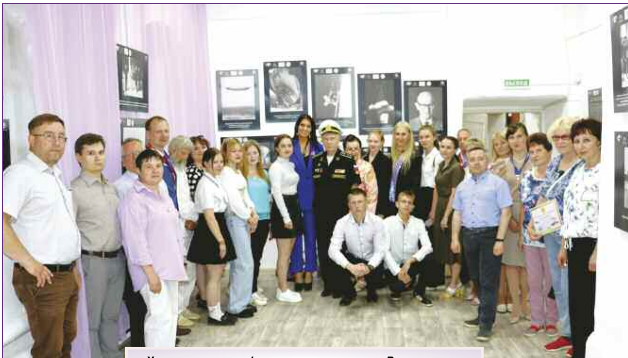
Участники и гости фотовыставки в музее п. Вохма.