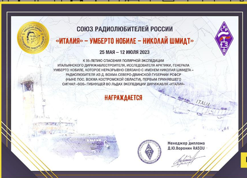
Юбилейный диплом СРР.