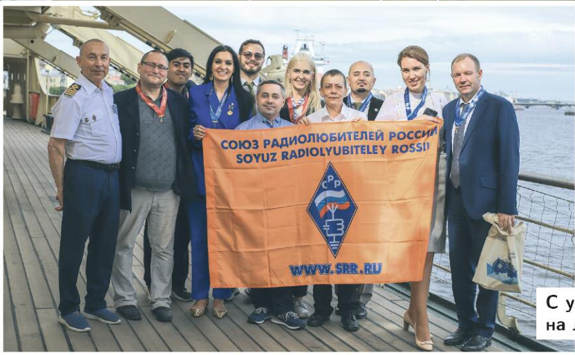
С участниками и гостями торжеств на ледоколе "Красин".