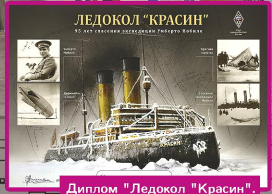
Диплом "Ледокол "Красин".