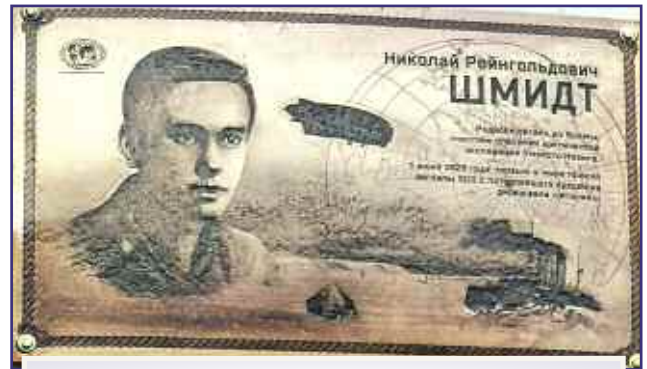
Мемориальная доска Н. Шмидта, музей п. Вохма.