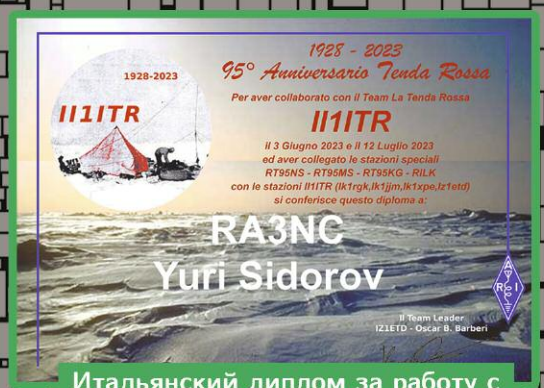
Итальянский диплом за работу с радиостанцией I111TR.