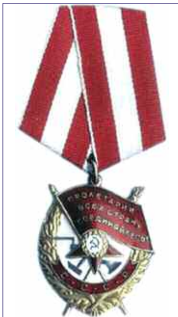
Орден Красного Знамени.

После демобилизации работал в НИИ ВВС РККА радиотехником. В иностранный отдел ОГПУ поступил 2 мая 1927 г. В центральном аппарате разведки он работал сначала переводчиком, затем — радистом.