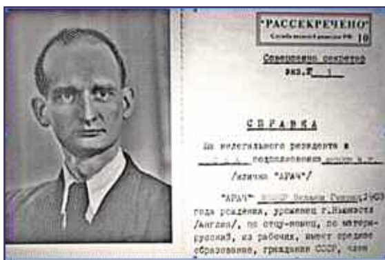
Справка на нелегального резидента — подполковника Вильяма Генриховича Фишера.