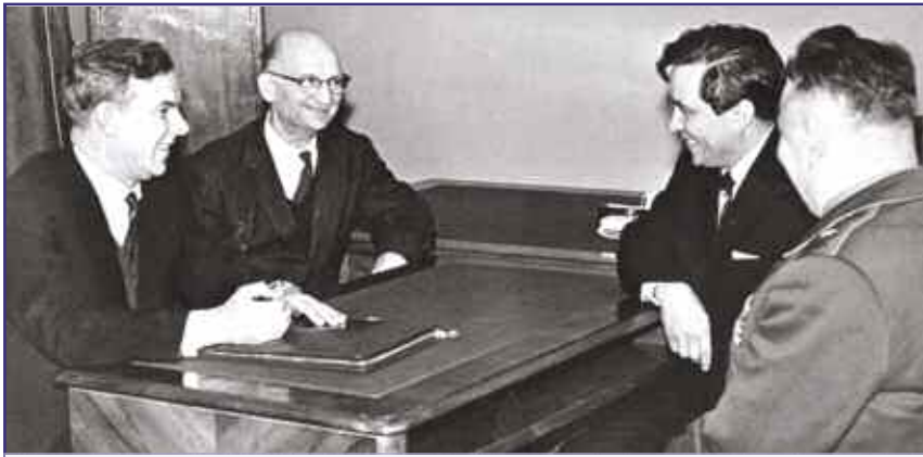
Председатель КГБ при Совете министров СССР В. Е. Семичастный (первый слева) принимает советских разведчиков Рудольфа Абеля (второй слева) и Конона Молодого (второй справа). Москва, сентябрь 1964 г.