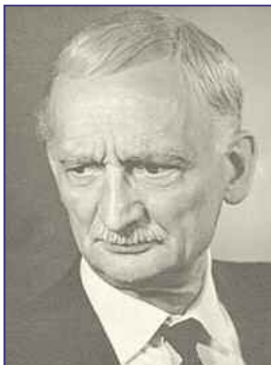
Рудольф Иванович Абель.

В 1924 г. Вильям Генрихович поступил в Институт востоковедения, где, согласно архивным материалам, берётся за изучение Индии, но через год был призван в армию — в 1-й радиотелеграфный полк Московского военного округа, где получил специальность радиста. Проходил службу вместе с Э. Т. Кренкелем и будущим артистом Михаилом Царёвым. Стал очень хорошим радистом.