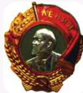
Внешний вид ордена Ленина, т. н. "третий тип", который вручался в 1936—1943 гг.