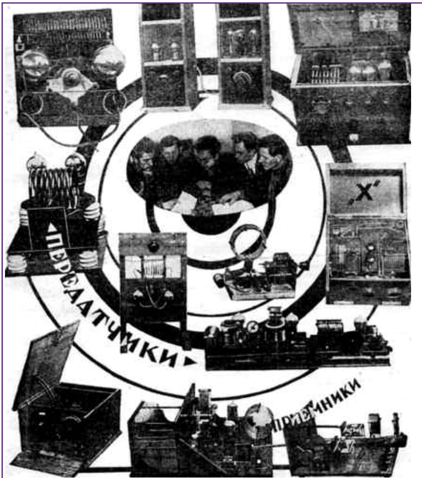
Выставка радиоловительских конструкций на первой Всесоюзной конференции коротковолнников.

В январе—феврале 1928 г. проводится Test EU-EE (СССР—Испания — прим. автора), в котором 20RA делит с 15RA второе место, они проводят по 7 QSO's с EE [2].