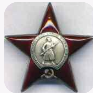
Внешний вид ордена Красной Звезды.

время войны был радистом одного из радиопунктов ГПУ, после войны — UA3DG/U3DG).