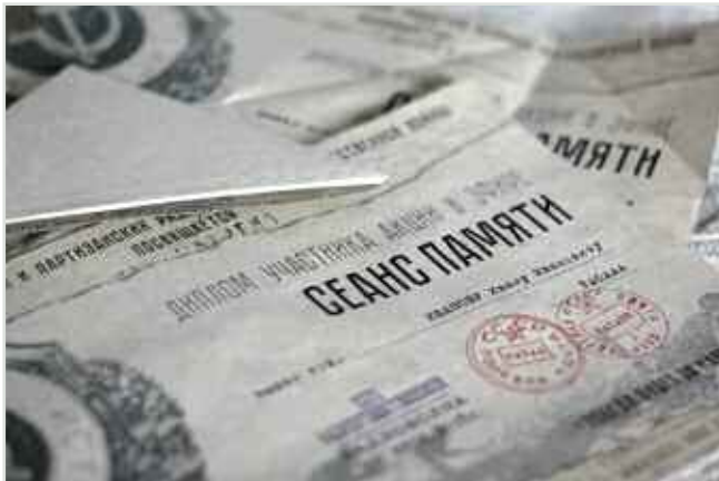
Памятный диплом об участии в "Сеансе Памяти".

"Утром 22 июня 2016 г. в назначенное время начал работать на указанных частотах. Земляки довольно быстро нашли меня в эфире. С ними было проведено несколько радиосвязей, а