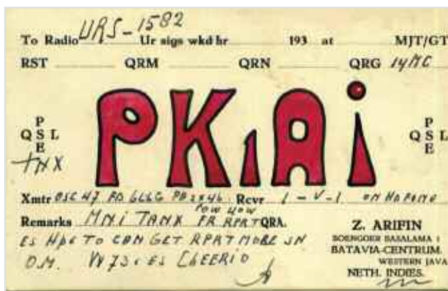
А эта QSL PK1AI пришла в Красноярск из бывшей голландской колонии, с острова Ява...