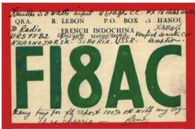
Эта QSL FIBAC пришла из далёкого Французского Индо-Китая — из города Ханоя...