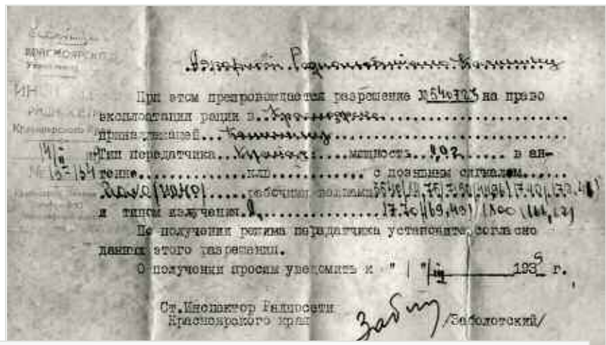
1939 г. — вот так выглядело разрешение на эксплуатацию любительской радиостанции UONO.

Через несколько дней был получен ответ — указанных нескольких улиц давно нет, а на некоторых вместо старых домов появились новые строения.