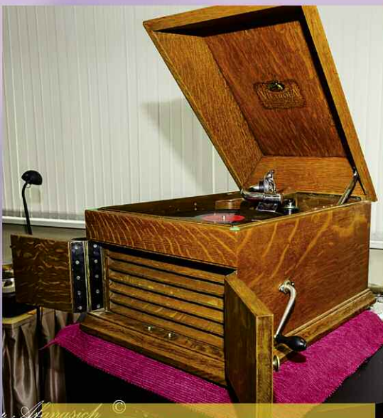
Аппаратура ретро была популярна.