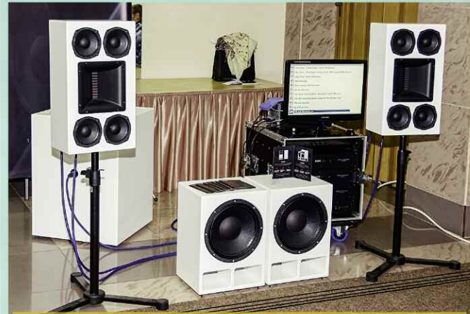
Акустические системы от компании Tulip Acoustics.