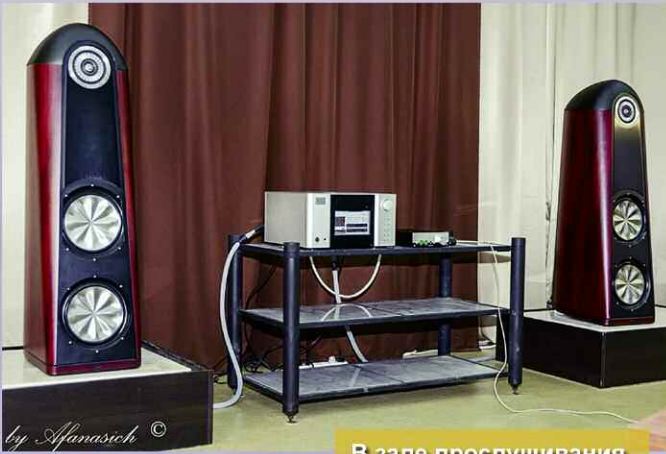
В зале прослушивания.