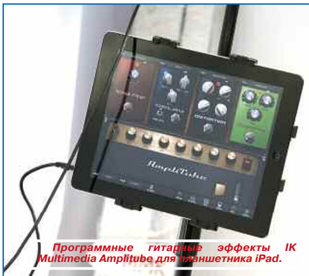
Программные гитарные эффекты IK Multimedia AmpliTube для планшета iPad.

Однако даже самый беглый просмотр списка участников, опубликованный на сайте, и программы выставки заставили многих призадуматься, а стоит ли тратить один из солнечных майских дней на посещение Экспоцентра. Не секрет,