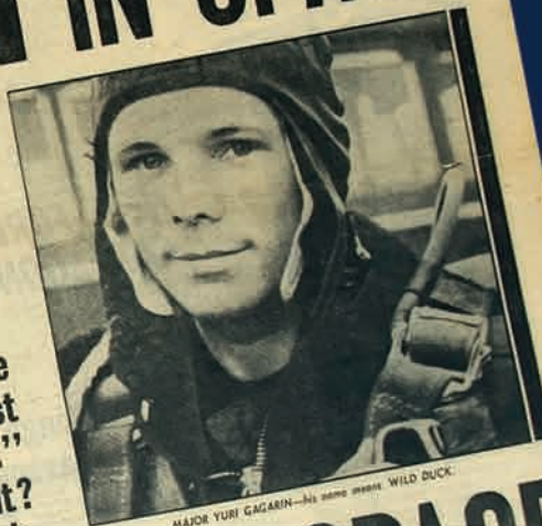
MAJOR YURI GAGARIN—his name means WILD DUCK.

Yesterday morning. A man family man. Yuri Gagarin. Around the world oceans and continents. "normal. I feel well." here in Russia just before the bound Britons. His first flight. "no injuries or bruises." "by this mighty achievement?"