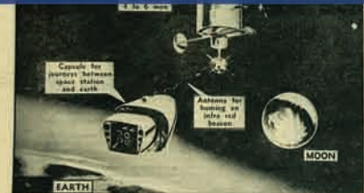
WHAT'S COMING NEXT? TAKE A LOOK INTO THE FUTURE. The next step... a space station hovering about 100 miles up in a orbit around the moon. It could hold ten to 20 men. The next step... a space station hovering about 100 miles up in a orbit around the moon. It could hold ten to 20 men.