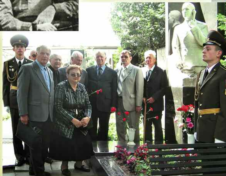
У могилы маршала на Новодевичьем кладбище в день его рождения собираются связисты.