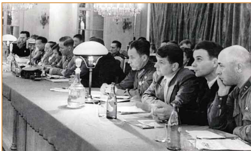
Собрание работников связи г. Москвы в Колонном зале Дома Союзов (июль 1942 г.).

Никто никогда не задумывался и понастолько не оценил усилия И. Т. Пересыпкина, Наркомата связи, работников органов связи на местах по организации связи во время эвакуации и раз-