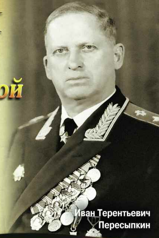
Иван Терентьевич Пересыпкин