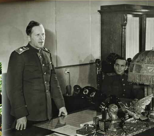
На встрече с героями-связистами (1944 год).