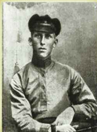
Курсант военно-политической школы (1923 год).