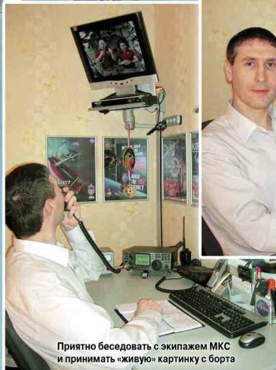
Приятно беседовать с экипажем МКС и принимать «живую» картинку с борта