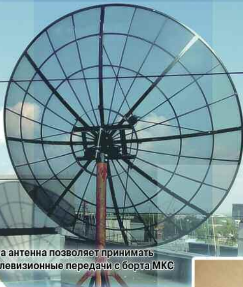
Эта антенна позволяет принимать телевизионные передачи с борта МКС