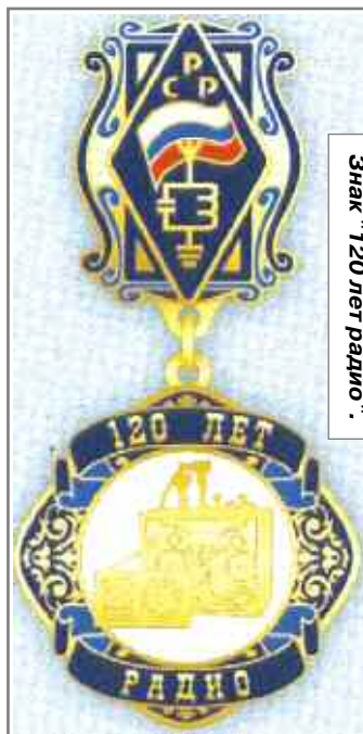
Знак "120 лет радио".