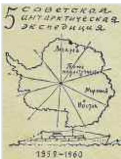
Рисунок с почтового конверта.