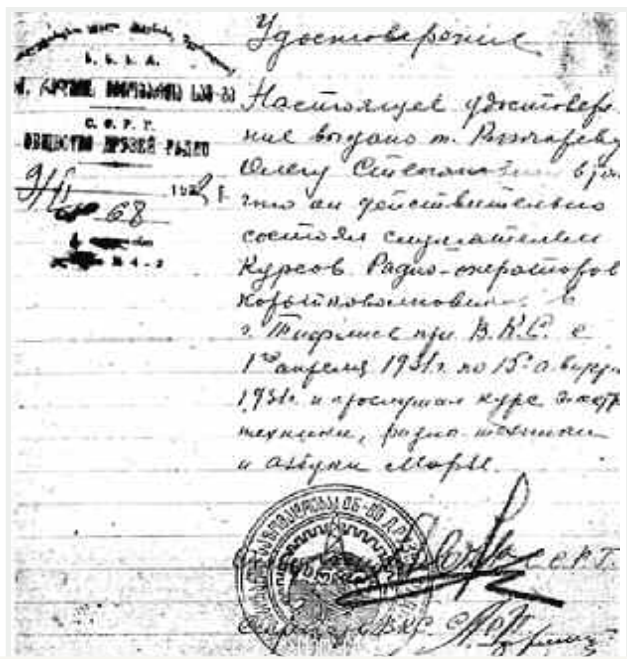
Удостоверение об окончании курсов радиооператоров при ВКС в г. Тифлисе.