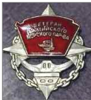
Знак "Ветеран Балтийского морского пароходства".