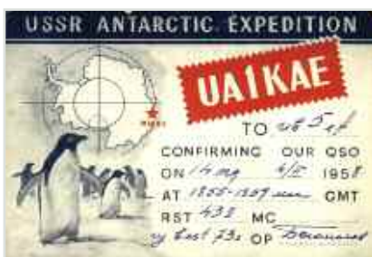
QSL радиостанции UA1KAE антарктической станции "Мирный".