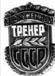
Значок "Заслуженный тренер СССР".