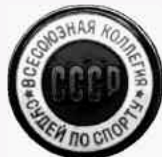
Значок "Всесоюзная коллегия судей по спорту".